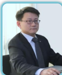
Ин Ки Ри Ижрочи Директор