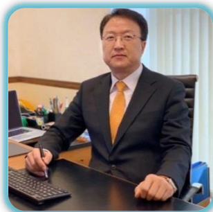
Жонг Сон Ким Бошқарув Раиси